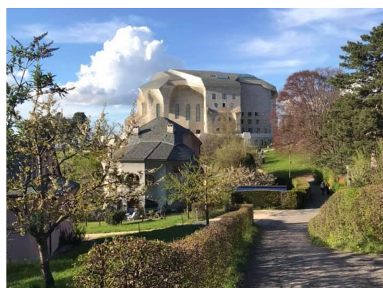
國際華德福幼兒教育聯盟(IASWECE) 位於瑞士的總部