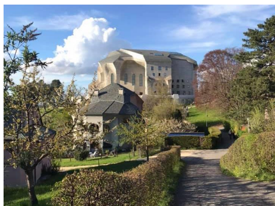
國際華德福幼兒教育聯盟(IASWECE) 位於瑞士的總部